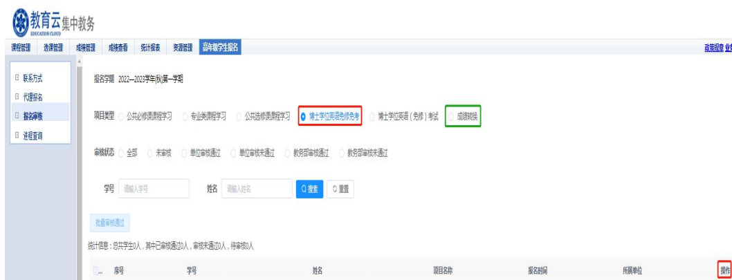
图 5 培养单位审核界面

第二步：“集中教务”——“高年级学生报名”——“报名审核”，进入“报名审核”页面，在“项目类型”处选择“博士学位英语免修免考”或“成绩转换”，页面即显示已报名的学生信息，请对符合报名条件的学生，在其信息条右侧操作区单击审核“通过”或“不通过”图标，即完成资格审核，审核界面见图 5。