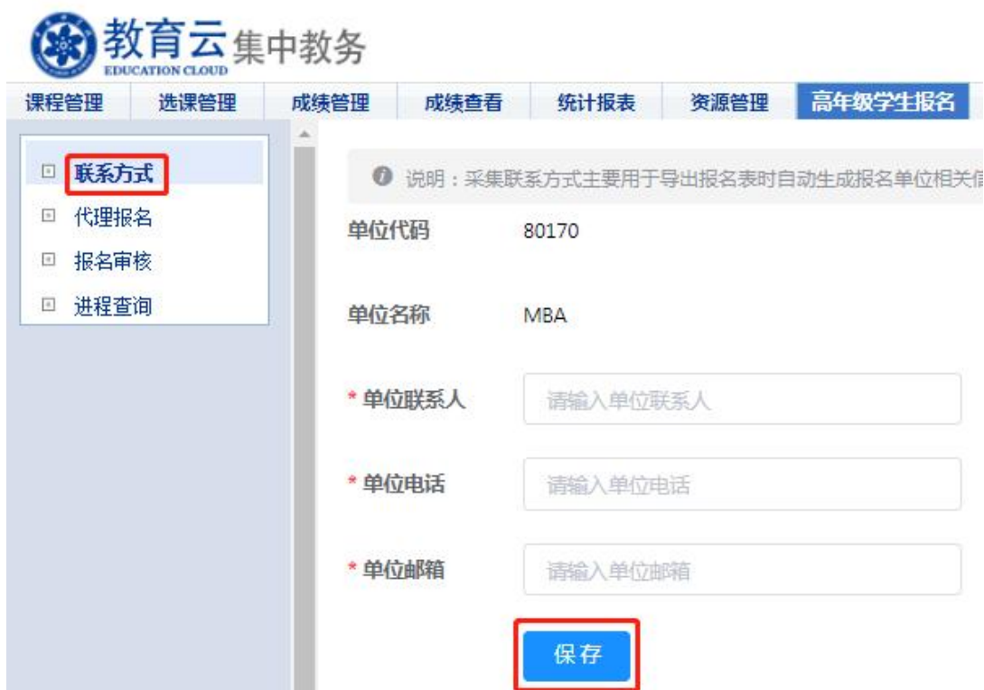
图 4 联系方式填写界面

第二步：“集中教务”——“高年级学生报名”——“报名审核”，进入“报名审核”页面，在“项目类型”处选择“博士学位英语免修免考”或“成绩转换”，页面即显示已报名的学生信息，请对符合报名条件的学生，在其信息条右侧操作区单击审核“通过”或“不通过”图标，即完成资格审核，审核界面见图 5。